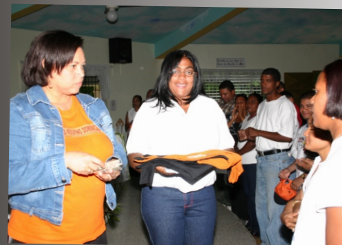
Oficialización Familia Kolping Nazaret