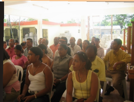
Encuentro de Directorios