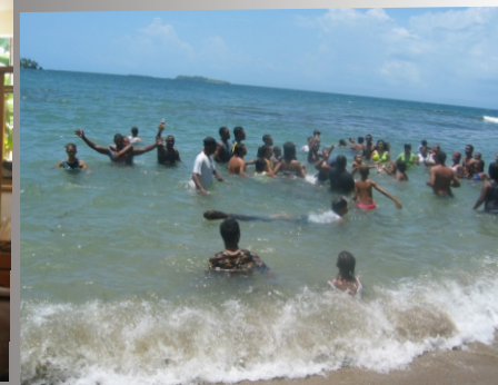
Actividad Recreativa en Samaná